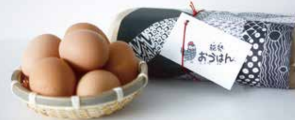
「能勢おはん」の卵は、能勢町観光物産センターで購入できる。