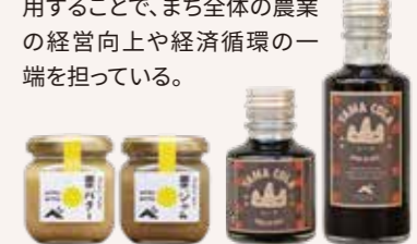
素材のそのものが持っている良さを大切に、思わず手にとりたくなる魅力的な商品を次々に開発。