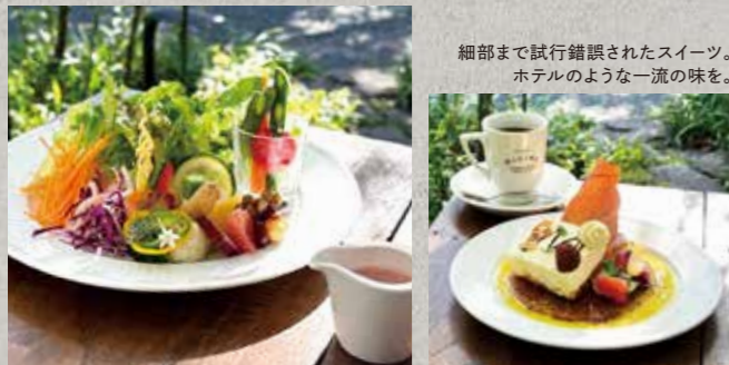
MIGIWAの名前を冠した特製サラダ。ドレッシングもすべて手作り。

森の中での食事にこだわって考案されたビーフシチューや人気のMIGIWAサラダ、デザートは、各分野の腕利きのシェフたちが調理を担当。最高の食材と共に使われる野菜はもちろん能勢産。各生産者、仕入先とは長い付き合いで、厳選した品を届けてもらっているのだとか。調和のとれた森の中、四季折々の景色と共に楽しめる食事とサービスを提供。こもれび、風、草の香り、鳥のさえずり...庭の自然を借景しながら五感で楽しむひとときを全身に感じて。