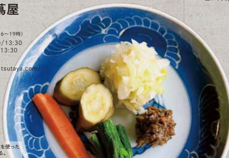
すべてのコースに、旬の野菜を使った「自家製の漬物」が付いてくる。

◆ 能勢町垂水246 ☎ 072-734-2774(16~19時) 🕒 平日 11:30/12:30/13:30 土・日・祝日 11:30/13:30 🔥 月、火(臨時休業あり) 🌐 https://sobakiri-tsutaya.com/