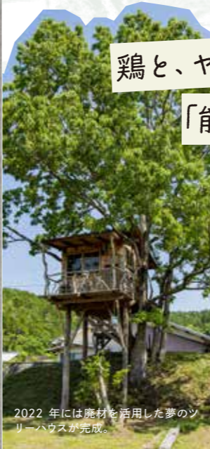
2022年には廃材を活用した夢のソーラーハウスが完成。

ゆったりと流れる時間の中で、自然の恵みと人のぬくもりが感じられる、田舎のおばあちゃんちのような民宿。昔ながらの日本家屋での宿泊プランは農業体験付き。体験の後の五右衛門風呂や、自分で収穫した野菜を使った夜のコース料理は格別!旬野菜の美味しさを知って、苦手な野菜が食べられるようになったお子さんもいるのだとか。そのほか、季節の野菜をつかったお惣菜buffetと石窯ピザが楽しめる気軽なランチ営業も。日頃のあれこれをひとやすみして、ちょっと「みちくさ」してみたいは?