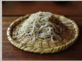
店までの道のりも含めて体が浄化されて癒されること間違いなし。