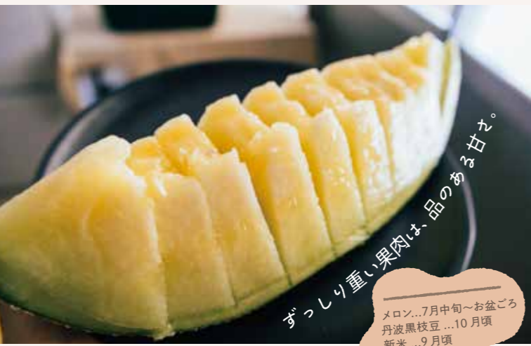
ずっしり重い果肉は、品のある甘さ。 メロン...7月中旬～お盆ごろ 丹波黒枝豆...10月頃 新米...9月頃