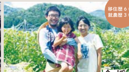
移住歴 6年 就農歴 3年