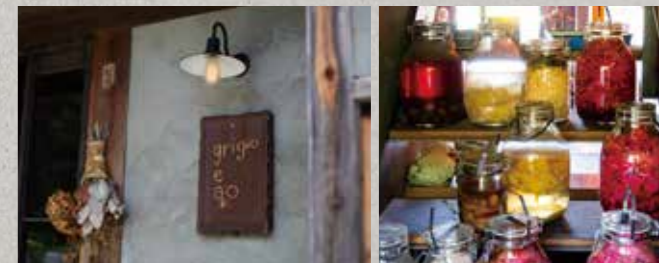
野菜が少ない端境期も里山の知恵で楽しむ。カラフルな野菜の瓶詰めが美しい。↑