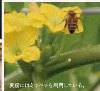
受粉にはミツバチを利用している。