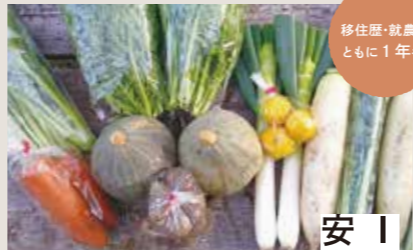
移住歴・就農歴 ともに1年半