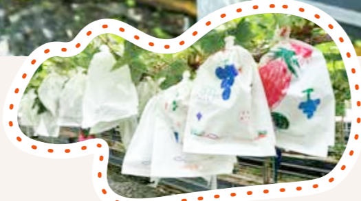
「オーナー樹木」エリアにはぶどうの袋掛けの袋に、お子さんの絵が描いてあり微笑ましい光景が広がる。