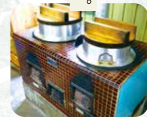
塩糍など 5～6 種類ある糍の商品以外にお味噌などを主として、様々な商品を作られています。