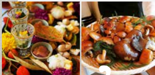
クリエイティブな発想に驚く料理の数々は、常に能勢の可能性を開拓しつづけている。