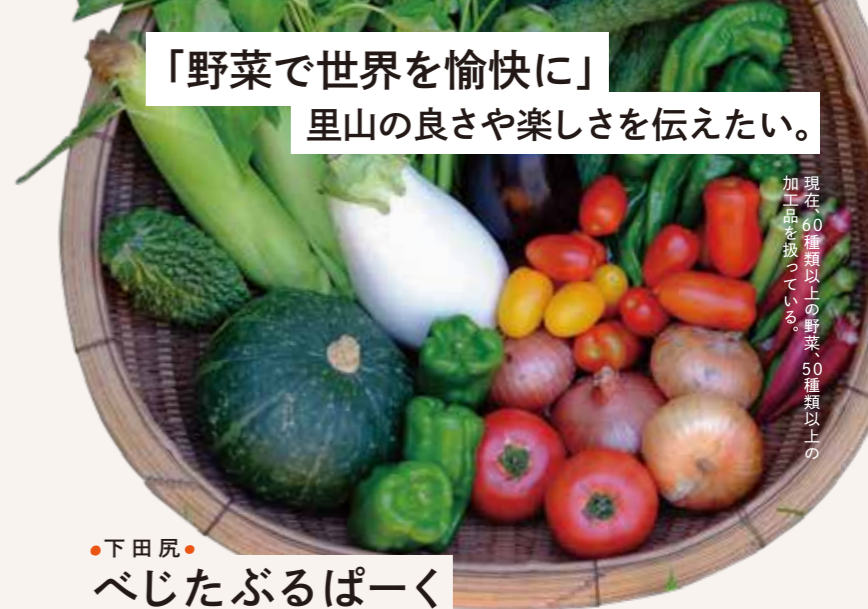
現在、60種類以上の野菜、50種類以上の加工品を扱っている。