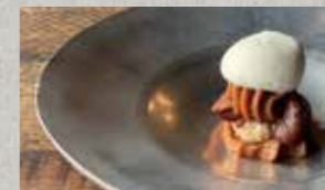
イタリアン版モンブランこと、モンテビアンコ

築80年の古民家を改装した落ち着いた雰囲気店内。農家さんへの感謝とリスペクトから生まれる料理たち。一番のおすすめ「季節のピッツァ」は、旬の野菜をふんだんに使い自家製窯で焼き上げた、シンプルながらも贅沢な味わい。