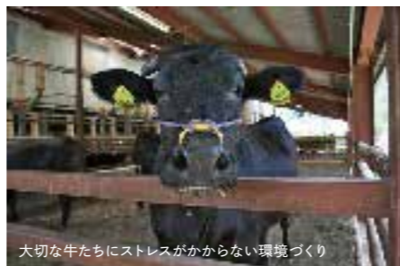
大切な牛たちにストレスがからない環境づくり

● 能勢町平野124-1 ☎ 072-734-0100 🕒 11:00~14:00 17:00~22:00 🌿 月