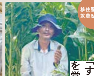
移住歴 14年 就農歴 14年