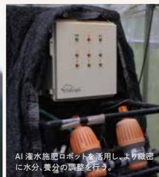
AI 灌水施肥ロボットを活用し、より緻密に水分、養分の調整を行う。