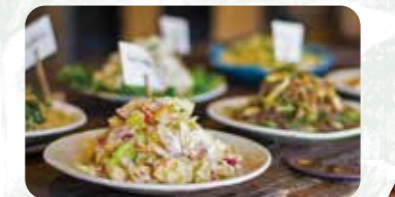
ランチ営業は週末限定。自家農園の無農薬野菜をたっぷり。旬の野菜やフルーツを乗せた石窯ピザは食べきりサイズ、いろいろな味を食べ比べてみて。